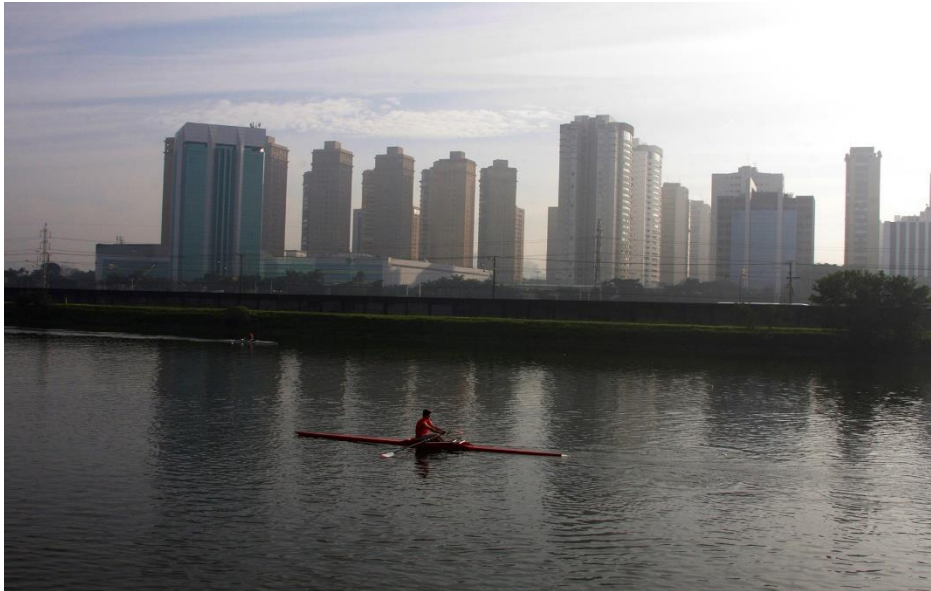
Praticante de remo na Raia Olímpica da USP.

Realizar 5 minutos de atividade bem leve com o material escolhido.